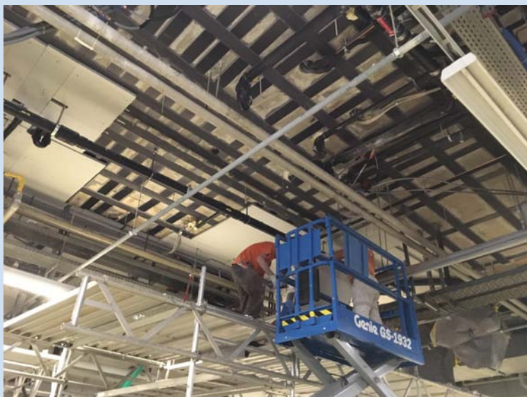
Lamellen kleben mit Hebebühne