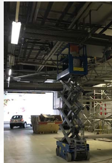
Hebebühne in der zentralen Anlieferung