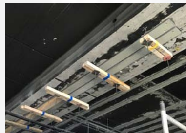
Montage der Lamellen