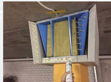
Verkleidung mit Brandschutzplatten