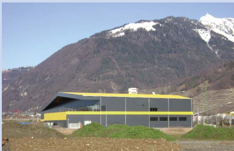
Centre de Bowling, Rennaz

La précontrainte a été utilisée pour les sommiers transversaux à l'aide de câbles de précontrainte du type CONA à torons 0.6" de force variable selon longueurs des sommiers de 1367 à 2788 kN à 0.70 ftk.