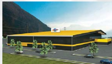
Centre de Bowling, Rennaz

Stahlton AG Bereich Bautechnik Wässerstrasse 29 CH-8340 Hinwil Tel.: +41 44 938 99 00 Fax: +41 44 938 99 01 bautechnik@stahlton.ch www.stahlton-bautechnik.ch