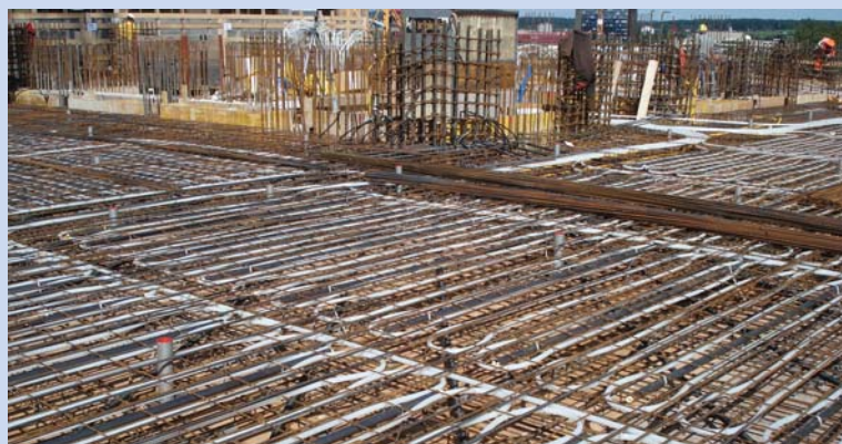
Bauphase von Juli 2010 bis April 2011

Stahlton AG Bereich Bautechnik Wässerstrasse 29 CH-8340 Hinwil Tel.: +41 44 938 99 00 Fax: +41 44 938 99 01 bautechnik@stahlton.ch www.stahlton-bautechnik.ch