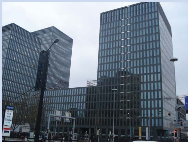
Main Tower, Oerlikon

In Zürich-Oerlikon entsteht ein Gebäude-Ensemble mit eindrucklicher Anmutung und Kubatur.