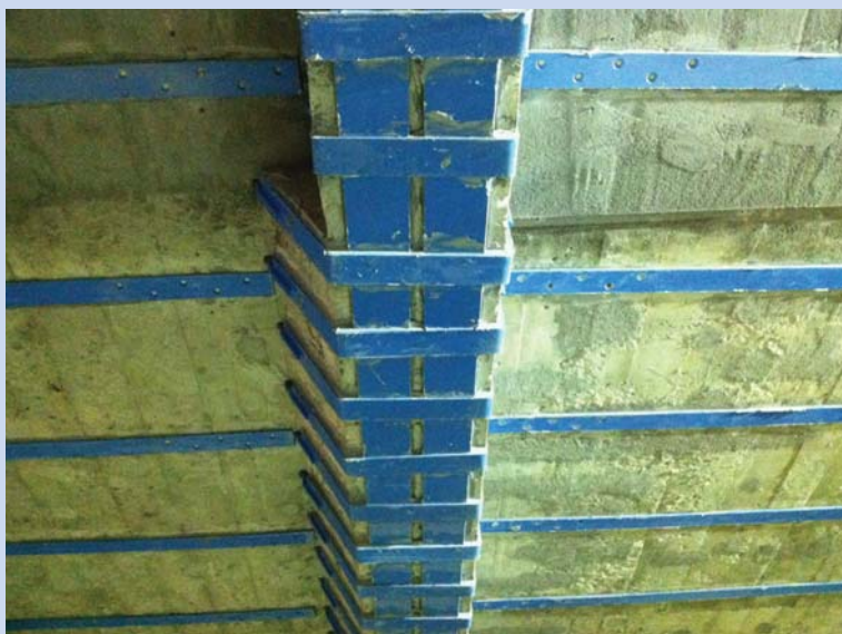
Decken- und Unterzugverstärkung