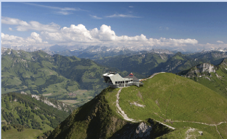
le sommet du Moléson

Maître d'œuvre: GMV, Moléson Bureau d'Ingénieurs: Paul Glassey SA, Haute-Nendaz AGC Géologie SA, Fribourg Entreprise de forages: AGEBAT SA, Bulle Entreprise générale: Grisoni-Zaugg SA, Bulle Etape du chantier: septembre 2010 à juin 2011