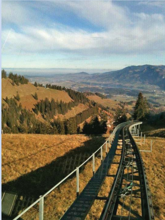
Funiculaire de Plan-Francey