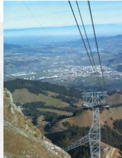
Pylône intermédiaire ancré