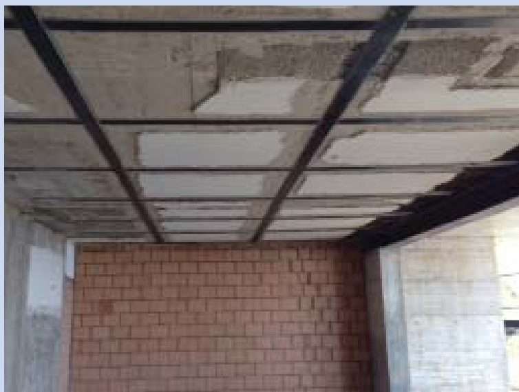
Decke mit geklebten CFK-Lamellen