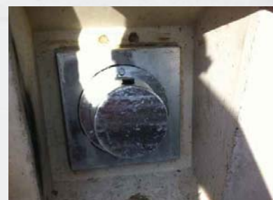
Anker nach Fertigstellung in Nische

Stahlton AG Bereich Bautechnik Wässeristrasse 29 CH-8340 Hinwil Tel.: +41 44 938 99 00 Fax: +41 44 938 99 01 bautechnik@stahlton.ch www.stahlton-bautechnik.ch