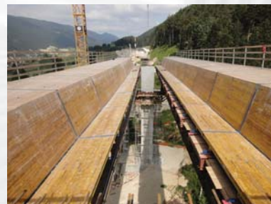
Pont amont en cours de réalisation

Il y a 225 t d'acier pour la précontrainte longitudinale et 27 t pour la précontrainte transversal réparti sur 19 travées : 9 pour le pont amont, 10 pour le pont aval.