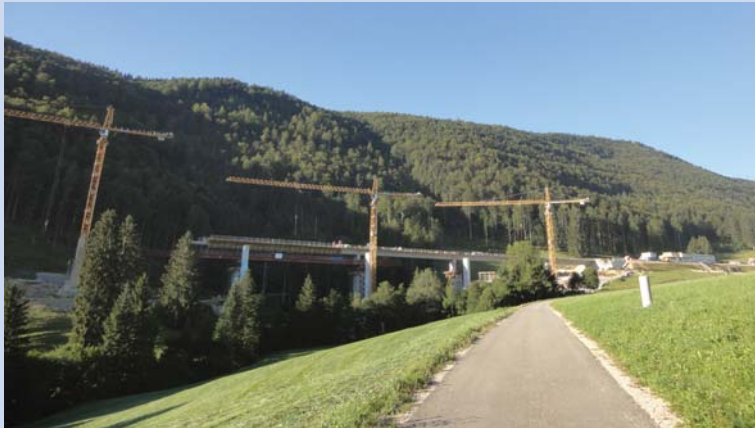
Pont amont en cours de réalisation

Chaque pont comprend deux voies de circulation de 3.75m et de chaque côté des voies, une bande de 1.30m pour le déneigement. La section transversale du tablier est constituée d'un caisson en béton armé avec une dalle de roulement en porte-à-faux précontrainte transversalement, épaisse de 25 à 45 cm. Les âmes inclinées ont