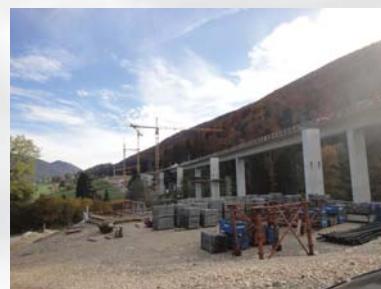
Pont amont en cours de réalisation

Stahlton AG Bereich Bautechnik Wässeristrasse 29 CH-8340 Hinwil Tel.: +41 44 938 99 00 Fax: +41 44 938 99 01 bautechnik@stahlton.ch www.stahlton-bautechnik.ch