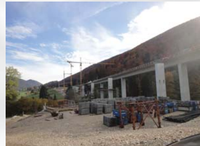
Obere Brücke während der Bauphase

Stahlton AG Bereich Bautechnik Wässerstrasse 29 CH-8340 Hinwil Tel.: +41 44 938 99 00 Fax: +41 44 938 99 01 bautechnik@stahlton.ch www.stahlton-bautechnik.ch