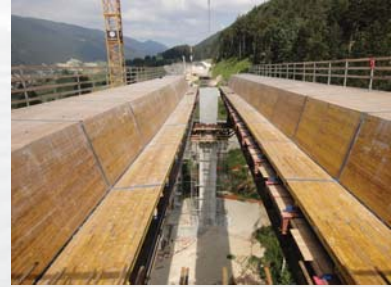
Obere Brücke während der Bauphase

Es wurden für die Längsvorspannung 225 t Spannstahl (8 Spannglieder 19-06 und 12 Spannglieder 22-06) und für die Quervorspannung 27 t Spannstahl verbaut.