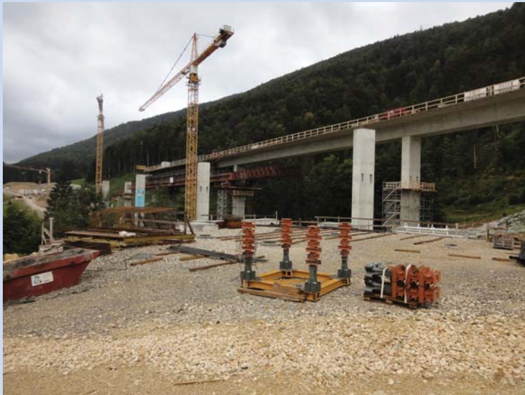
Verschiebung der Schalungen

Die Bauzeit beträgt 4 Jahre. Die erste Überbaustappe wurde im April 2013 betoniert, die letzte ist für Ende 2014/Anfang 2015 geplant.