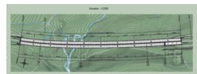
Ansiht und Schnitt der Brücken