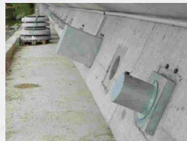
Versuchsanker prüfen Messanker, Reserveankerstützen und Kontrollanker