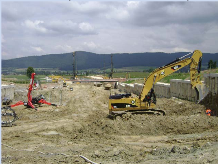
Gesamtansicht vom Tunnelportal vor dem Aushub

Die Ankerarbeiten wurden am 15. Mai 2011 abgeschlossen. Die Eröffnung der Autobahn ist für 2016 vorgesehen.