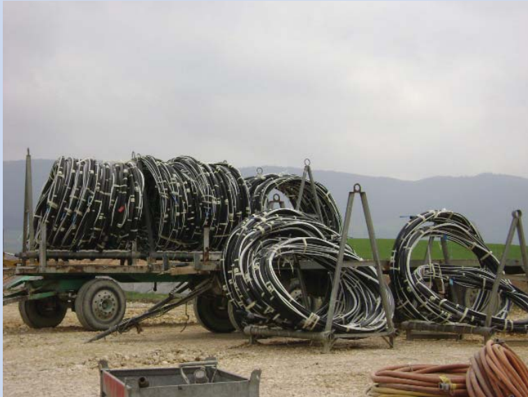
Anker vor der Installation