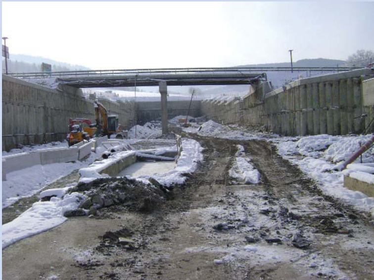
Aushub im Winter